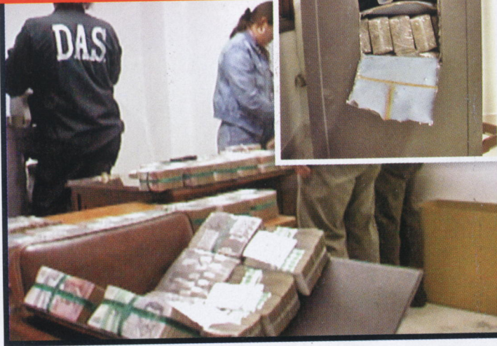
Las autoridades allanaron propiedades en Neiva y Bogotá buscando lo que consideran el botín del desfalco a Cajanal y encontraron depósitos de dinero (izquierda). Luego el fiscal general, Mario Iguarán, y el director del DAS, Andrés Peñate (derecha), presentaron los resultados del operativo